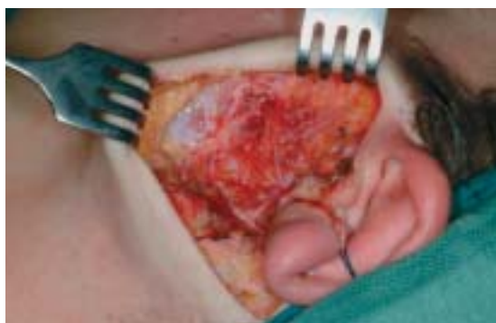
Figuur 3. Patiënte met een middelgroot pleiomorf adenoom. Net als in Fig. 2 is te zien dat met name bij het vrijleggen van de cervicomandibulaire vertakking van de n. facialis onder de huidlap geprepareerd dient te worden.

nervus facialis niet te beschadigen. Uiteindelijk ontstaat op deze manier een U-vormige lap, waarmee in principe voldoende expositie over de glandula parotis kan worden verkregen (Fig. 2). Afhankelijk van de grootte van de tumor kan de expositie worden verruimd door het occipitale deel van de incisie te verlengen.