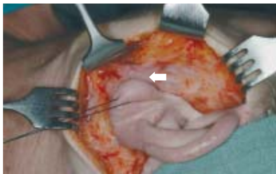
Figuur 2. Na het ontwikkelen van de U-vormige huidlap kan voldoende expositie over de glandula parotis worden verkregen.